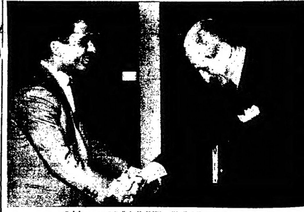
جلالة الملك المعظم انام تشرف الميراثي بالقبلة السامية

سدين روبرت كندي كان تقصده هون في المنفى المترجم بالقصير يرضى الرد على أسئلة المحققين ويصر على ان اسمه هون لا لوس انجلس - رويتر - أعلن المترجم بيغ سالينغر المساعد الصحفي للسناتور روبرت كندي الراحل ان جثمانه سيدفن في مقبرة أرلتون الوطنية التي دفن فيها شقيقه الرئيس جون كندي اثر اغتياله سنة ١٩٦٣ وفاة كندي وكان السناتور كندي الذي يبلغ من العمر ٤٢ سنة قد اصيب في رأسه وقتله في احد ضواحي لوس انجلس امس الاول بعد دقائق من انتصاره في انتخابات ولاية كاليفورنيا الأولية لمرحلة الثانية على الصفحة الرابعة عمود ٢